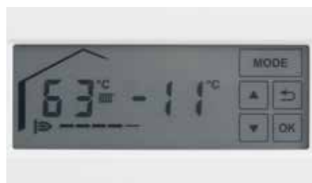
Podsvícený dotykový LCD displej.

Nástěnné plynové kondenzační kotle Vitodens 100-W a Vitodens 111-W se ovládají přes nový podsvícený LCD dotykový displej. Displej je snadno čitelný a dá se komfortně obsluhovat i ve tmě.