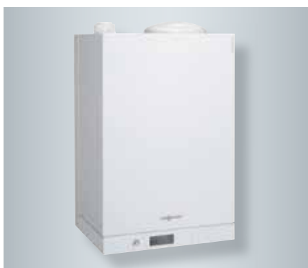
Vitodens 111-W s integrovaným 46litrovým nabíjecím zásobníkem z ušlechtilé oceli.