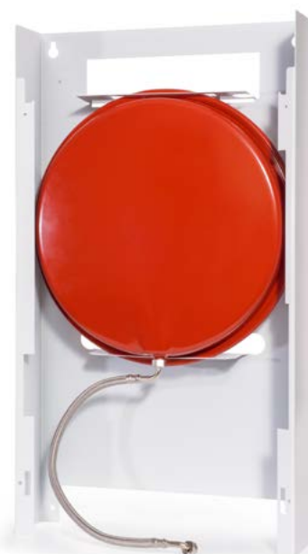
093437, 093447, 093457