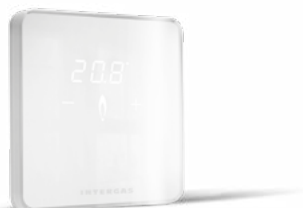
pokojevý Open Therm termostat Comfort Touch s drátovou komunikací

Variantu termostatu ON-OFF lze doplnit v případě potřeby o venkovní čidlo pro ekvitermní řízení kotle.