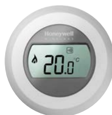
pokojevý Open Therm termostat HRE s bezdrátovou komunikací