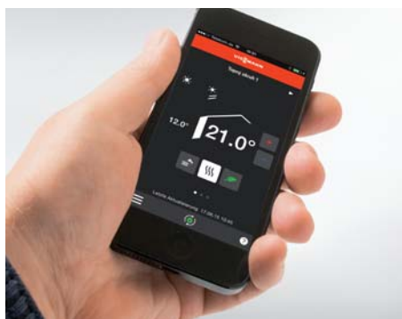
Komfortní obsluha přes aplikaci Viessmann pomocí chytrého telefonu.

Kompaktní kotel na kusové dřevo je vynikajícím doplněním stávajících olejových a plynových topení. V bivalentním provozu převezme základní dodávky vytápěcího tepla a teplé vody. Teprve při velmi nízkých teplotách se zapne běžný kotel k pokrytí potřebného špičkového zatížení.